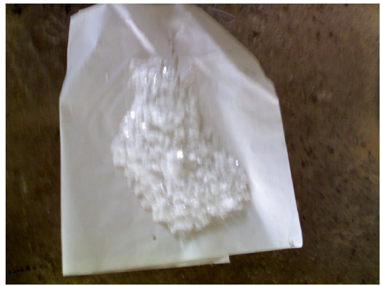
ผงโซดาไฟชนิดเกล็ด