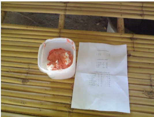
สูตรที่ใช้ และ ปูแดง