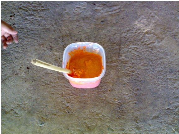
นำมาผสมรวมกัน