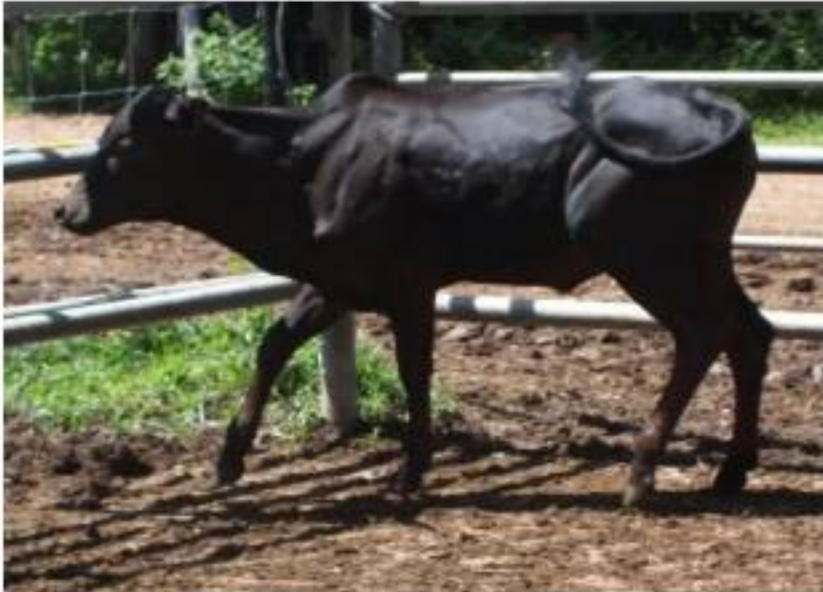
รูปที่ 1 โคพื้นเมือง หมายเลข NON 79/62 น้ำหนัก 83 กก. ๗ ละ 90 บาท ราคาเริ่มต้น 7,470 บาท