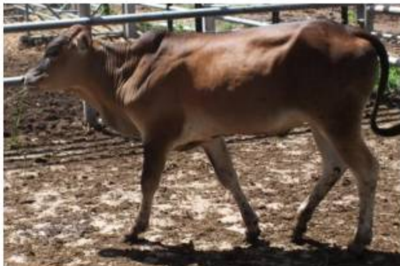
รูปที่ 7 โคพื้นเมือง หมายเลข NON 85/62 น้ำหนัก 78 กก. ๑ ละ 60 บาท ราคาเริ่มต้น 4,680 บาท