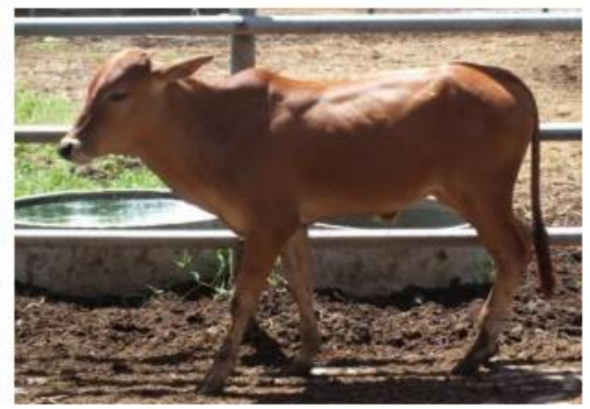
รูปที่ 3 โคพื้นเมือง หมายเลข NON 88/62 น้ำหนัก 96 กก. ๗ ละ 90 บาท ราคาเริ่มต้น 8,640 บาท