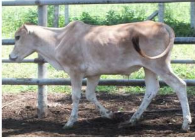
รูปที่ 2 โคพื้นเมือง หมายเลข NON 87/62 น้ำหนัก 85 กก. ๗ ละ 90 บาท ราคาเริ่มต้น 7,650 บาท